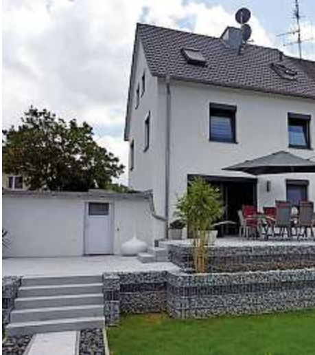
Neues Dach, neue Fenster und ein top angelegter Garten werten diese Doppelhaushälfte in Bayreuth auf.

Immobilienbewertung: Ist der Preis zu hoch, finden Sie keine Interessenten. Ist er zu niedrig, verschenken Sie Geld. Gebelein Immobilien ermittelt den genauen Wert Ihrer Immobilie.