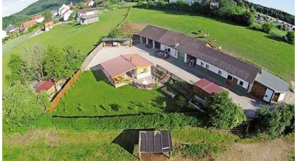
Der Traum vieler Pferdeliebhaber: einen eigenen Pferdehof besitzen. Doch zahlreiche unterschiedlicher Faktoren, wie die Lage, Größe der Anlagen, Ausstattung oder die Anzahl der Gebäude beeinflussen den Preis.

L age, Lage und noch mal Lage: Das ist die häufigste Antwort auf die Frage, was den Wert einer Immobilie bestimmt. Die Lage ist sicherlich auch ein wesentlicher Einflussfaktor für die Wertermittlung einer Immobilie - aber eben nicht der einzige. Gebelein Immobilien kennt auch die anderen. Einfamilienhaus, Reihenhäuser, Fachwerkhäuser - auch der Haustyp spielt eine wesentliche Rolle. Und nicht zuletzt Baubeschaffenheit, Qualität und Zustand von Dach, Fenstern, Bad oder Heizung. Extras wie ein schön angelegter