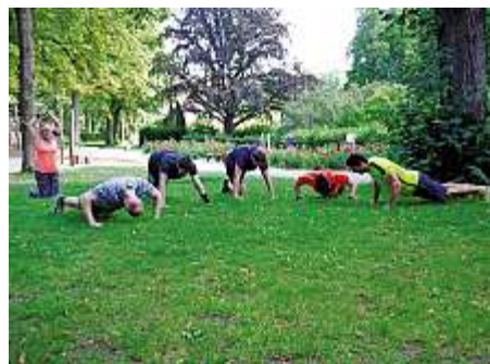
Outdoor-Kurse, wie hier im Röhrensee, gehören zum festen Bestandteil bei PrimeFit.

Bei PrimeFit in der Kanzleistraße 8 in Bayreuth erhalten Sie zehn Prozent KurierCard-Bonus auf den gesamten Kursplan sowie auf Personaltraining.