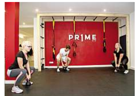
Ein regelmäßiges High Intensity Training in der Mittagspause reicht aus, um fit zu bleiben.